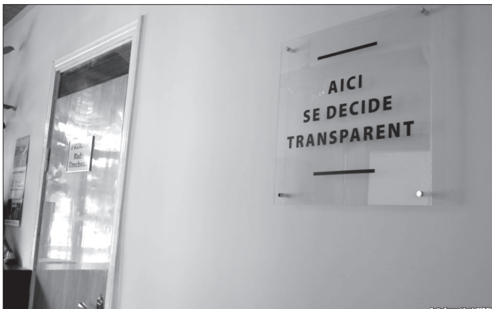
La primăria din Larga