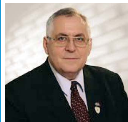
EMIL DRĂGHICI, PREȘEDINTELE ACoR

"Am participat la prea multe sfârșituri neîncepute sau doar începute, dar niciodată la începuturi care să aibă continuare. Nutrim convingerea că actuala guvernare își va manifesta plener voința în continuarea unui început din 2013, prin semnarea aici, în fața dumneavoastră, a unui PACT, acord de parteneriat, care să consfințească priorități și soluții cu termene de rezolvare și rapoarte de progres!"