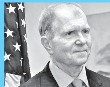
William Moser, ambasadorul SUA în Republica Moldova:

Așadar, Guvernul american este nemulțumit de faptul că implementarea legii de descentralizare a finanțelor publice locale a fost amânată până în 2015. Anume această decizie a servit drept motiv pentru care a fost sistată finanțarea din partea SUA, susține ambasadorul Statelor Unite ale Americii la Chișinău, William Moser, într-un interviu pentru postul de televiziune PRO TV.