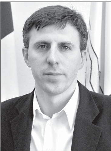
Dorin Chirtoacă, primar de Chișinău:

P robleme sunt multe de tot și toate necesită rezolvare în regim de urgență. Drumuri locale și infrastructura lasă mult de dorit . Nu poți să spui autonomie dacă nu ai finanțe. Atunci când nu ești finanțat definitiv, mai depinzi și nu poți să faci ceea ce ai putea să faci. Ce înseamnă autonomie? Să le ai pe toate la dispoziție: legi, finanțe, dorință, angajați. Sper că aleșii locali se vor face auziți, mai ales în ceea ce privește autonomia bugetelor locale!