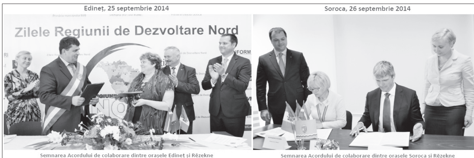
Semnarea Acordului de colaborare dintre orașele Edineț și Rēzekne

Orașele Edineț și Soroca vor colabora cu orașul Rēzekne din Letonia. Două acorduri în acest sens au fost semnate la Edineț și Soroca, în contextul celei de-a doua ediții a Zilelor Regiunii de Dezvoltare Nord, eveniment organizat, în perioada 24-27 septembrie a.c., de Agenția de Dezvoltare Regională Nord (ADR Nord), sub egida Ministerului Dezvoltării Regionale și Construcțiilor, în parteneriat cu Primăria municipiului Bălți și Primăriile orașelor Edineț și Soroca.