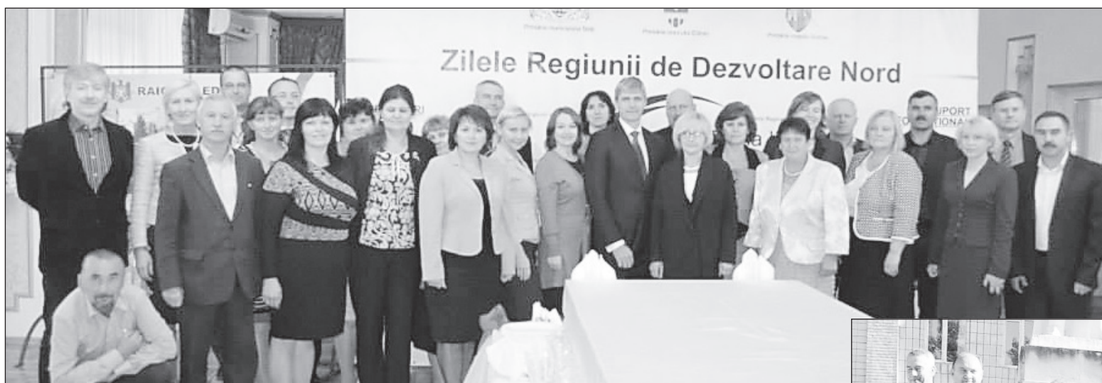
Semnarea Acordului de colaborare dintre orașele Soroca și Rēzekne

namentale din Letonia sunt interesate să cunoască cât mai multe exemple de dezvoltare de succes din nordul Republicii Moldova.